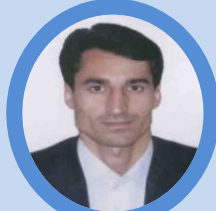
احمدی نژاد قاضی محترم