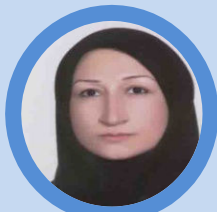
وظیفه دان کارشناس مامائی