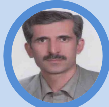
عسلی نظام پرستاری